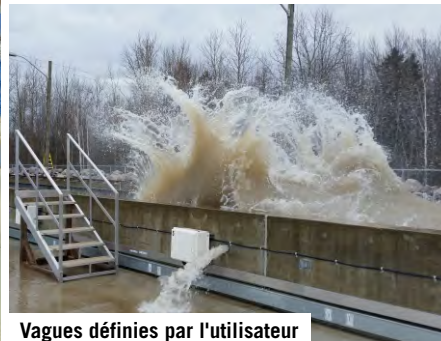
Vagues définies par l'utilisateur