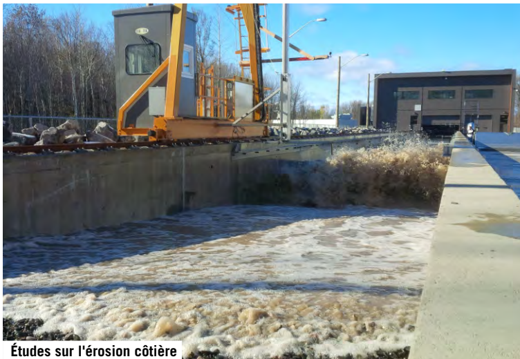
Études sur l'érosion côtière