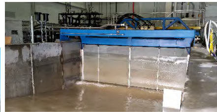
Longueur de course : 4 m - vitesse max : 4 m/s