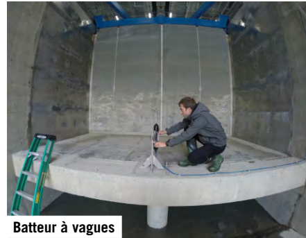
Batteur à vagues

Le canal a 120 m de long et 5 m de profondeur et de largeur. Il a été conçu pour simuler les interactions de vagues, marées, courants et du transport de sédiments. Les vagues sont produites par un batteur à vagues de type piston, dont la longueur de course maximale est de 4 m et la vitesse maximale de 4 m/s. Le canal est aussi équipé d'un système d'absorption active de houle. Différents types de conditions initiales peuvent être créés incluant des vagues régulières et irrégulières et un ensemble de fonctions peuvent être définies par l'utilisateur, par exemple pour simuler des tsunamis causés par des glissements de terrain ou des tremblements de terre. Des vagues de grande amplitude atteignant la hauteur des murs du canal peuvent être produites pour des profondeurs d'eau entre 2,5 et 3,5 m et des vagues ayant des périodes entre 3 et 10 s.