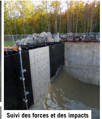
Suivi des forces et des impacts